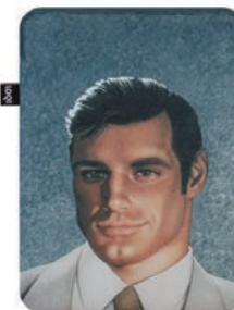
TOM OF FINLAND LS.TF.DN