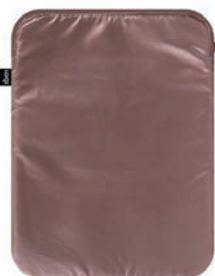
METALLIC Rose Gold LS.MM.RO