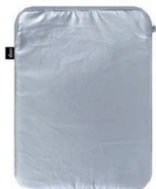
METALLIC Silver LS.MM.SI