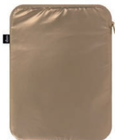
METALLIC Gold LS.MM.GO