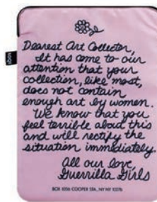
GUERRILA GIRLS LS.GG.DC